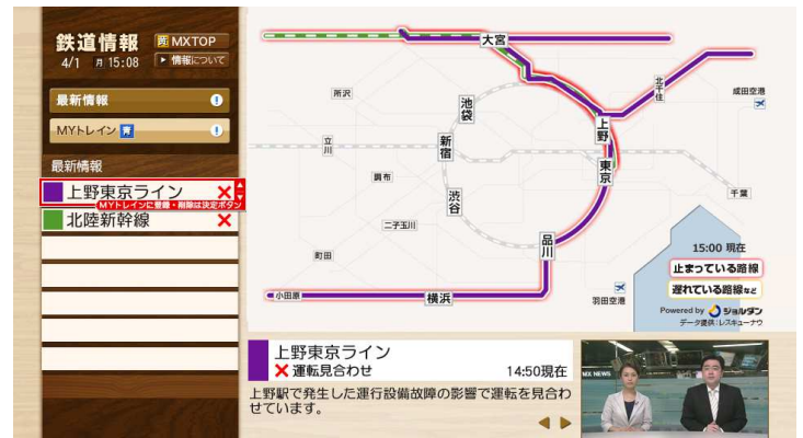
(データ放送内「鉄道情報」画面サンプル)